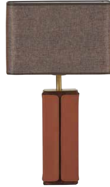
Deri gövdeli abajur, 1.199 TL, Enza Home; (0216) 452 57 32.

Renk geçişlerinin kusursuz bir dengede kullanıldığı Elif Arslan Interiors imzası taşıyan projeden ilham alıyoruz.