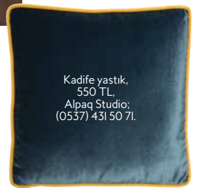
Kadife yastık, 550 TL, Alpaq Studio; (0537) 431 50 71.