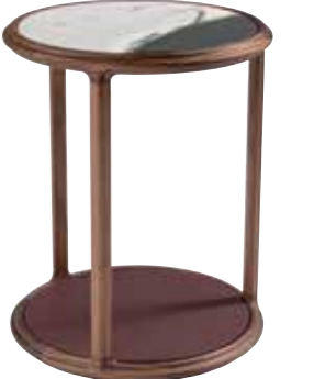
Kings Cross yan sehpa, fiyat istek üzerine, Visionnaire; (0212) 265 75 12.