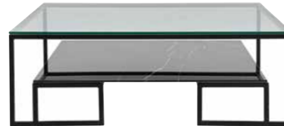
Cam sehpa, fiyat istek üzerine, Mudo Concept, mudo.com.tr