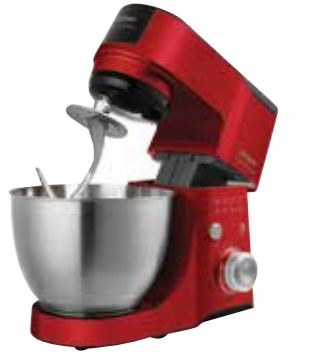
Crust Mix Plus Stand mikser, 6.999,90 TL, Arzum; arzum.com.tr