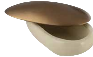
Dekoratif kutu, fiyat istek üzerine, Kelebek Mobilya; (0216) 383 78 78.