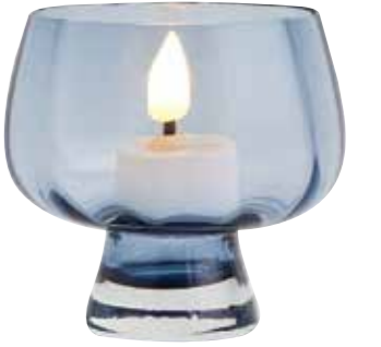
Cam tealight, 119,90 TL, H&M Home; (0212) 245 72 46.