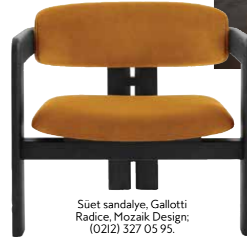
Süet sandalye, Gallotti Radice, Mozaik Design; (0212) 327 05 95.