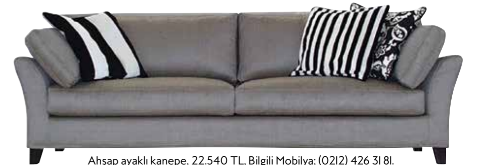
Ahşap ayaklı kanepa, 22.540 TL, Bilgili Mobilya; (0212) 426 31 81.