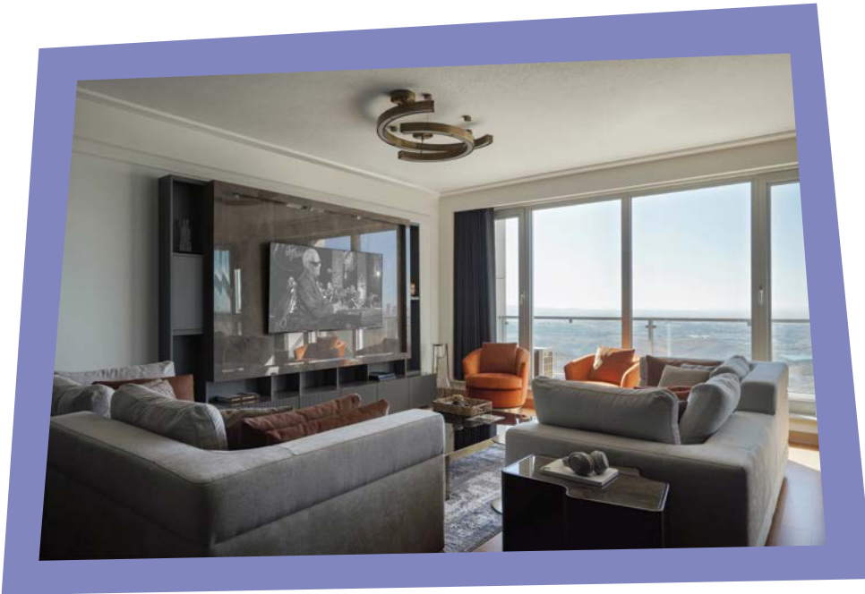
ESK Evi